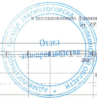
Разбивочный план красных линий