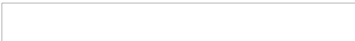
Схема границ проектирования