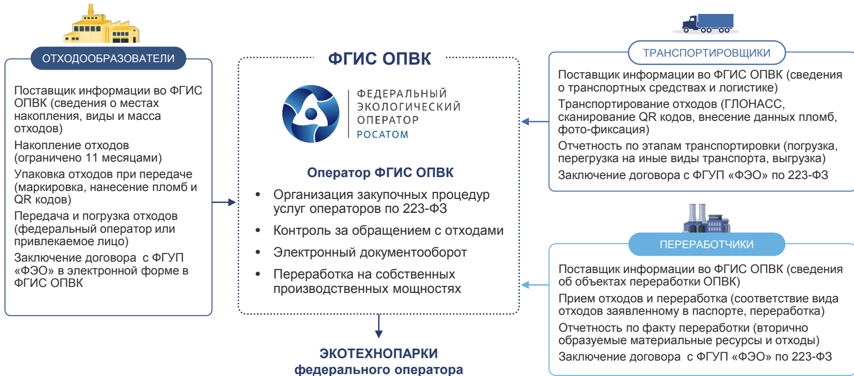
Схема обеспечения учета и контроля за обращением с отходами I-II классов опасности (постановление Правительства РФ № 1346 от 18.10.2019)